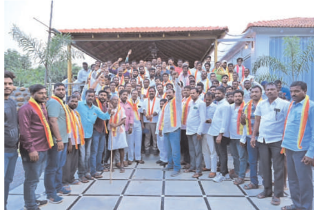
చెరువుల మరమ్మత్తు చేసి ఉచితంగా చేప మత్స్య కార్మికులకు వాహనాలు సైతం పిల్లలు పంపిణీ చేస్తున్నట్లు తెలిపారు. అందించారని తెలిపారు. బిఆర్ఎస్