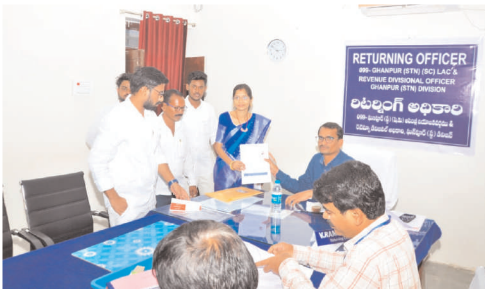
తీవ్రంగా విమర్శించారు గ్రామ గ్రామాన సమస్యలపై పోరాటాలు చేస్తామని ఓట్లు అడుగుతామని వారు తెలిపారు

స్టేషన్ ఘనూర్, నవంబర్ 9, మనం న్యూస్ : స్టేషన్ ఘనూర్ మండల కేంద్రంలోని ఆర్డీవో ఆర్డీవో కార్యాలయంలో గాదే వర్ష ఎన్నికల అధికారి రామూర్తికి నామినేషన్ పత్రాలు అందజేశారు. ఈ సందర్భంగా గాదే పుద్ది వర్షా మాట్లాడుతూ నియోజకవర్గంలో అనేక సమస్యలు ఉన్నాయని సమస్యలు పరిష్కరించడంలో ప్రభుత్వాలు విఫలమవుతున్నాయని అందుకోసమే ఈ నియోజకవర్గంలోని ఒక మహిళగా నామినేషన్ వేసి వారి సమస్యలు పరిష్కరించేందుకు నా వంతు కృషి చేస్తానని ఆమె అన్నారు రాష్ట్రంలోని భారత రాష్ట్ర సమితి కేంద్రంలోని బిజెపి ప్రభుత్వాలు ఈ రాష్ట్ర ప్రజలను అనేక ఇబ్బందులకు గురి చేస్తున్నారని నిత్యవసర వస్తువులు ధరలు పెంచి ప్రజల నడ్డి విరుస్తున్నారని వారు