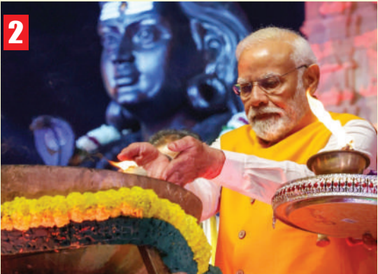
ఘనంగా ముగిసిన కోటి దీపాత్సవం వేడుకలు