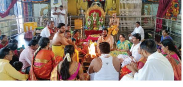
చిల్వూర్, నవంబర్ 19, మనం న్యూస్ : చిల్వూరు గుట్టా శ్రీ బుగులు