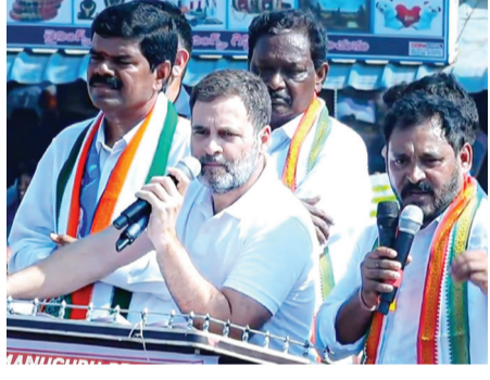
మణుగూరు, నవంబర్ 17 (మనం న్యూస్) : కేసీఆర్ ప్రతి సభలో కాంగ్రెస్ ఏం చేసిందని అడుగుతున్నారు. కాంగ్రెస్ తెలంగాణ ఇబ్బందుని, నీవు రాజువై కూర్చుని పాలిస్తున్నావని ఏపీసీ అగ్రనేత రాహుల్ గాంధీ పేర్కొన్నారు. సార్వత్రిక ఎన్నికల ప్రచారంలో భాగంగా భద్రాద్రి కొత్తగూడెం జిల్లా పినపాక నియోజకవర్గ మండల కేంద్రమైన ..మిగతా 2లో

కాళేశ్వరం ప్రాజెక్టు ద్వారా కేసీఆర్ కుటుంబానికి లబ్ధి అధికారంలోకి వచ్చాక తిన్నదంతా కక్కించి పేదలకు పంచుతాం ఏపిసిసి అగ్ర నేత రాహుల్ గాంధీ జనసంద్రంగా మారిన మణుగూరు అగ్రనేత రాకతో పినపాకలో కాంగ్రెస్లో నయా జోష్