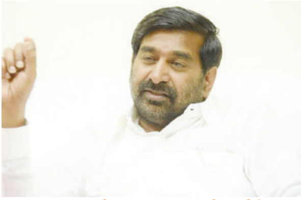
ప్రజలు ఇబ్బంది పడే పనులను సహించే ప్రసక్తేలేదు

అధికార బిఆర్ఎస్ పార్టీని అడ్డం పెట్టుకుని ప్రజలను ఇబ్బందిపెట్టే పనులను మా పార్టీ నాయకులైన సరే గడివిన 9 సంవత్సరాలలో ఏనాడు సహించలేదని, ఇప్పుడు పార్టీని వీడి తనపై విమర్శలు గుప్పించిన వారు అత్యుపమర్శ చేసుకోవాలన్నారు. తమ ఆటలు తన పాలనలో సాగవని తెలిసి పార్టీతో తెగింపు చేసుకుని, బిఆర్ఎస్ పార్టీకి మద్దతు తెచ్చే విధంగా ఆరోపణలు చేస్తున్నారని, ఇటీవల ప్రతిపక్షాలు తరుచు విమర్శిస్తున్న విధంగా తానెప్పుడు ఏ సామాజిక వర్గాన్ని కించపరిచే విధంగా వ్యవహరించలేదని ఒక ప్రశ్నకు బదులిచ్చారు.