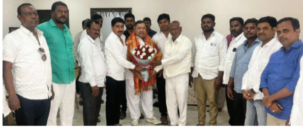
వికారాబాద్, నవంబర్ 05, (మనం ప్రతినిధి): తాండూరులో ఎమ్మె