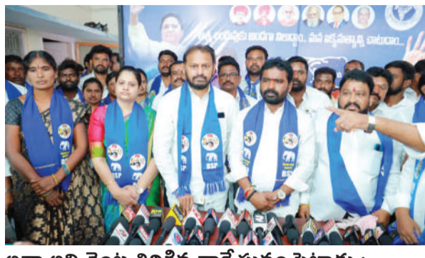
అన్నా అని వెంట తిరిగిన నాకే సున్నం పెట్టాడు :

ఉద్యమకారుడు రమేష్ 2001 నుండి తెలంగాణ ఉద్యమంలో రాష్ట్ర ఏర్పాటు కోరకు మంత్రి గుంటకండ్ల జగద్దేవరెడ్డితో కలిసి పోరాటం చేసిన తనను వెంట తిప్పుకుని, మంత్రిగా బాధ్యతలు చేపట్టిన తర్వాత ఉద్యమ కాలంలో పోరాటం చేసిన వారికి కనీసం గౌరవం ఇవ్వకుండా అగౌరవ పరిచిన సంఘటనలు ఎన్నో ఉన్నాయన్నారు. కౌన్సిలర్ అధికార బిఆర్ఎస్ పార్టీలో ఉన్న నేను కౌన్సిల్లో జరుగుతున్న అవినీతి అక్రమాలను ప్రభుత్వ తనను తిరుగుబాటు దారుడని ముద్ర వేశారని, కొంతమంది నాయకుల చెప్పుడు మాటలు విని 2019లో కౌన్సిలర్ పార్టీ నుండి బిఎమ్ ఇవ్వకుండా అవమాన పరిచారని, అంతేకాకుండా ఎలాగైనా తనను ఓడగొట్టాలని ఎన్ని నిర్బంధాలు చేసిన వాడు ప్రజలు గుండెల్లో పెట్టుకుని స్వతంత్ర్య అభ్యర్థిగా తన సతిమణి రాధికి గెలిపించి కౌన్సిల్ కు పంపారని తెలిపారు. ప్రతిదీ డబ్బుతో కొనలేదేనీ విషయాన్ని మంత్రి గుర్తు పెట్టుకోవాలన్నారు. సూర్యాపేట అసెంబ్లీకి పోటీ చేసినందుకు 50 సం. అ తర్వాత బిసి బిడ్డ జానయ్య యాదవ్ బిఎస్పీ నుండి అవకాశం కల్పించిందని, రాజకీయాలకు కులమతాలకు అతీతంగా బిసెలంకా ఏకైక జానయ్య గెలిపించుకోవాలని పిలుపునిచ్చారు.