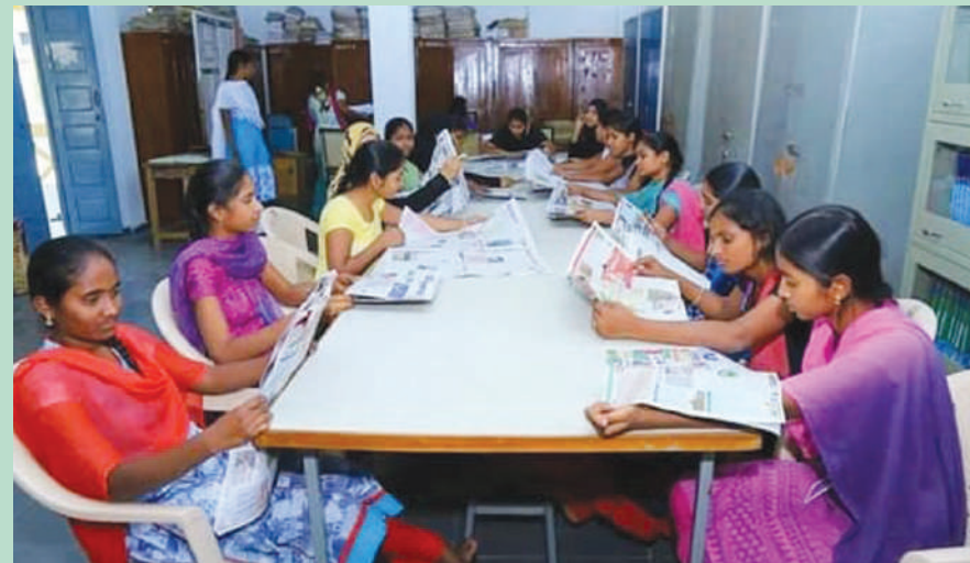
చదువరులకు సేవలందిస్తాయి. పుస్తకాల గురించి చర్చకు వచ్చినట్లయితే దేశవ్యాప్తంగా ఉన్న పౌర గ్రంథాలయాలలో ఆ ప్రాంత పరిసర జనాభా కనుగుణంగా గ్రంథాలయాల ఏర్పాటు చేయబడలేవు అనేది వాస్తవం. ముఖ్యంగా దక్షిణాది రాష్ట్రాల్లో కర్ణాటక, కేరళ ఈశాన్య రాష్ట్రాలలో మిజోరం ఉత్తరాది రాష్ట్రాలలో ఢిల్లీ, హర్యానా రాష్ట్రాలలో ఉన్న పుస్తక సంపద ప్రస్తుత చదువరులకు కనుగుణంగా ఉన్నది. తమిళనాడు, కేరళ ఆంధ్రప్రదేశ్, తెలంగాణ, కర్ణాటక రాష్ట్రంలో పుస్తక సంపద బాగా ఉన్నప్పటికీ అది ప్రస్తుత చదువరుల అవసరాలకు అనుగుణంగా లేదని ఒకటి రెండు రాష్ట్రాల్లో మాత్రమే బాగా ఉన్నాయని నర్సేలు చెబున్నాయి.