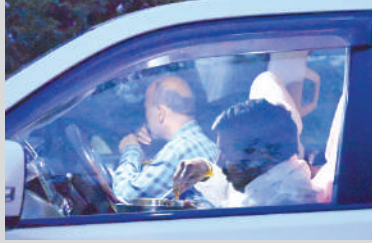
సూర్యాపేట నవంబర్ 24 మనం ప్రతినిధి:

నాకు జన్మనిచ్చింది మా అమ్మ... కానీ.. జనం కోసమే నా జన్మ.. జనం కోసం బ్రతకాలనుకున్నప్పుడు... నేను తినే ఆ నాలుగు మెతుకులు ... ఇంట్లో కుటుంబ సభ్యులతోనే కలిసి తినాలనేమీ లేదు.... అది గుడిలో కావచ్చు.. బడిలో కావచ్చు... నన్ను గమ్యస్థానానికి చేర్చే నా ప్రచార వాహనమే కావచ్చు.... నా లక్ష్యం ఒక్కటే.. ప్రజా సేవ.. నా ఆశయం ఒక్కటే.. అదే.. జనహితం.... (రోజూ ఎన్నికల ప్రచార కార్యక్రమాలతో తీరిక లేక శుక్రవారం రాత్రి.. పాత సూర్యాపేటలో పొద్దు పోయాక.. కారులోనే భోజనం చేస్తున్న సూర్యాపేట బీఆర్ఎస్ అభ్యర్థి, మంత్రి గుంటకండ్ల జగదీష్ రెడ్డి)