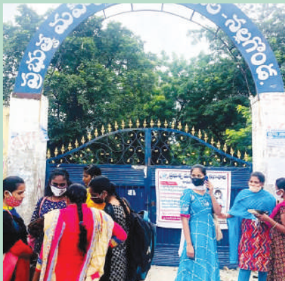
సమతుల్యంగా ఉన్నవా, గ్రంథాలయాలలో సేవలు అందించే గ్రంథ పాలకులు ఉన్నారా, గ్రంథాలయ భవనాలు సరిగా ఉన్నవా, మౌలిక వసతులు అన్ని సమపాక్షాల్లో ఉన్నప్పుడు మాత్రమే గ్రంథాలయాలు

- విజ్ఞానాన్ని అందించడంలో గ్రంథాలయాలు కీలకపాత్ర పోషిస్తాయి - రాజా రామ్మోహన్ రాయ్ లైబ్రరీ ఫౌండేషన్ గ్రంథాలయాలకు సహాయ సహకారాలు అందిస్తుంది