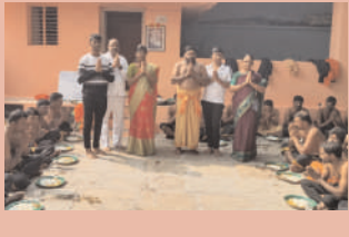
త్రిపురారం నవంబర్ 15 మనం న్యూస్: త్రిపురారం మండల కేంద్రం లోని సాయిబాబా ఆశ్రమం నందు కార్తీక మాసం పురస్కరించుకొని మహా అన్నదానం