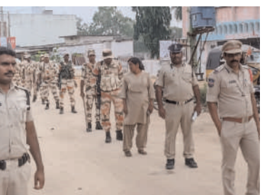
టిబెట్ బార్డర్ ఫోర్స్ 30 మంది సాయుధ పోలీసులు పాల్గొన్నారు.

నాయకులు, ప్రజలు పోలీసులకు సహకరించాలని విజ్ఞప్తి చేశారు. ర్యాలీలకు సమావేశాలకు పోలీసుల అనుమతి తప్పనిసరిగా తీసుకోవాలి ఎన్నికల నిబంధనలు ప్రతి ఒక్కరూ తప్పకుండా పాటించాలని సూచించారు శాంతిభద్రతలకు విఘాతం కలిగించేలా ప్రవర్తిస్తే కఠినంగా శిక్షిస్తామని హెచ్చరించారు. ఈ షాగ్ మార్చ్ లో హెడ్ కానిస్టేబుల్ సర్పంచ్, కానిస్టేబుల్ సైదులు, హోంగార్డు సంద్యతో పాటు ఇందో