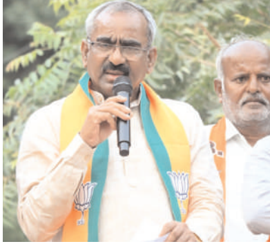
పథకాలతో ఓట్లు అడుగుతున్నారని, వేల కోట్ల రూపాయలు కేంద్ర ప్రభుత్వం రాష్ట్రానికి సంక్షేమం పేరుతో నిధులను మంజూరు చేసిందని, గ్రామాలలో జరుగుతున్న అన్ని అభివృద్ధి పనులకు కేంద్ర