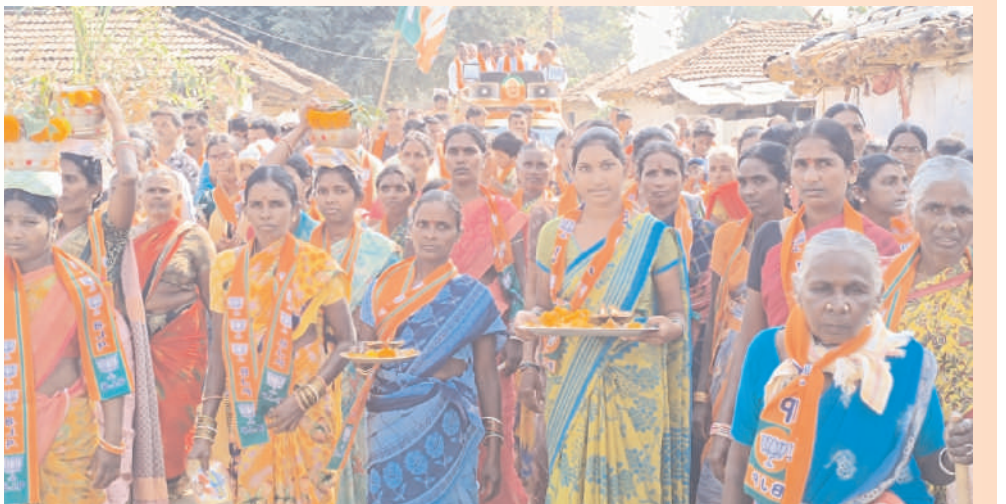
తెలిపారు. నిరుద్యోగులతోపాటు పేద ప్రజల సమస్యలపై అసెంబ్లీలో గళం విప్పిన