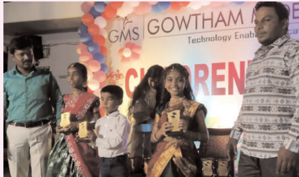
-గాతమ్ మోడల్ స్కూల్లో...