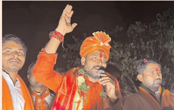
బిఆర్ఎస్ కార్యకర్తలే అన్నారు. ఒక్కసారి తనకు అవకాశం ఇవ్వాలని కోరారు. ఓటు వజ్రాయుధం లాంటిదని, ప్రజలు సరైన నిర్ణయాన్ని తీసుకొని బీజేపీ పార్టీకి ఓటేయాలని అన్నారు.