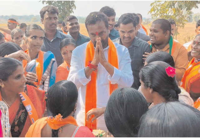
దుబ్బాక/దుబ్బా టౌన్, నవంబర్ 17, మనం న్యూస్: అగ్రవర్ణ పేదల్లోని నిరుద్యోగులను, నిరుద్యోగులను అదుకునేందుకు ఈడబ్ల్యూఎస్ ద్వారా పది