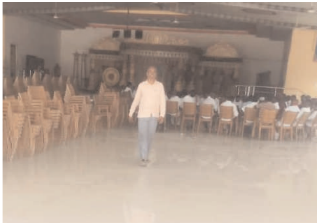
వస్తుందని పలువురు భావిస్తున్నారు.

కొండపాక, నవంబర్ 11, మనం న్యూస్: కుకునూరుపల్లి మండల వ్యాప్తంగా బిఆర్ఎస్ నాయకులు రెండుగా విడిపోయారు. కేసీఆర్ నాయకత్వంలో బిఆర్ఎస్ నాయకులు ఎన్నికల ప్రచారంలో కొన్ని రోజులుగా దూసుకుపోయినప్పటికీ రెండు రోజుల నుండి కుకునూరుపల్లి బిఆర్ఎస్ కార్యకర్తలు, ముఖ్య నాయకుల మధ్య సయోధ్య కుదరకపోవడంతో రెండుగా విడిపోయారు. నమ్మదగిన సమాచారం ప్రకారం ముఖ్య నాయకులకు మండల ఇంచార్జ్ సమాచారం ఇవ్వడం లేదని మంత్రి దృష్టికి తీసుకుపోగా ఇంచార్జ్ను మంత్రి మందలించినట్లు తెలిసింది. దీన్ని దృష్టిలో ఉంచుకొని ఇంచార్జ్ కొంతమందికి క్షమాపణ చెప్పినట్లు సమాచారం. ఇంచార్జ్తో క్షమాపణలు చెప్పించడం పట్ల పార్టీ నాయకులు వ్యతిరేకించారు. శనివారం సమావేశమైన ముఖ్య నాయకులు కొంతమంది నాయకుల వల్ల పార్టీ అప్రతిష్టపాలవుతుందని, ఇదేవిధంగా కొనసాగితే పార్టీలో మనుగడ కొనసాగించలేమని హెచ్చరించినట్లు సమాచారం. దీనిపై మంత్రి స్పందించకుంటే పార్టీ భారీ మూల్యం చెల్లించుకోవాల్సి