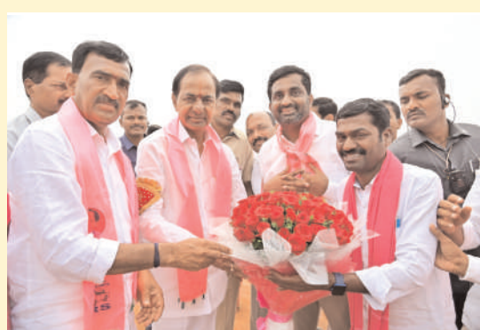
గజ్వేల్ లో కేసీఆర్ నామినేషన్