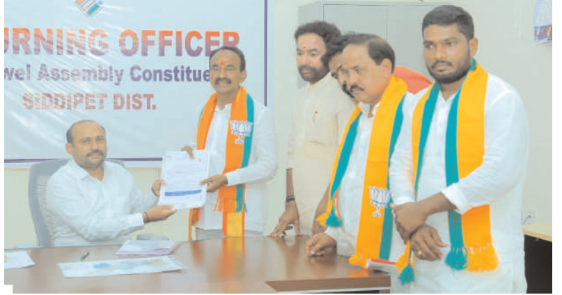
గజ్వేల్ నియోజకవర్గ బీజేపి అభ్యర్థిగా ఈటల రాజేందర్ నామినేషన్ కార్యక్రమంలో కిషన్ రెడ్డి పాల్గొన్నారు. ముందుగా కోట మైసమ్మ దేవాలయం మిగతా 2లో..

గజ్వేల్/ జగదేవ్ పూర్, నవంబర్ 07, మనం న్యూస్: ఆత్మబలి దానాలు, అమరుల త్యాగం, సబ్బండ తెలంగాణ ప్రజల పోరాటంతో సాధించుకున్న తెలంగాణ నేడు ఒక్క కుటుంబం కోసమే అన్న చందంగా మారిందని కిషన్ రెడ్డి పైర్ అయ్యారు. మంగళవారంనాడు