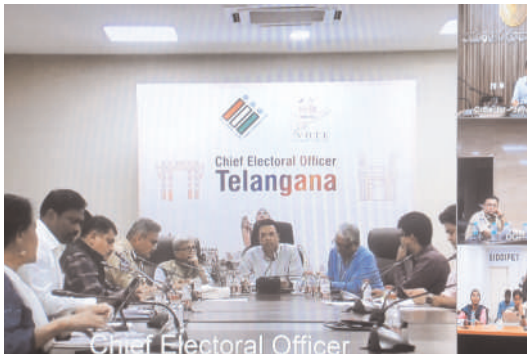
నిష్పక్షపాతంగా విధులు నిర్వహించాలి