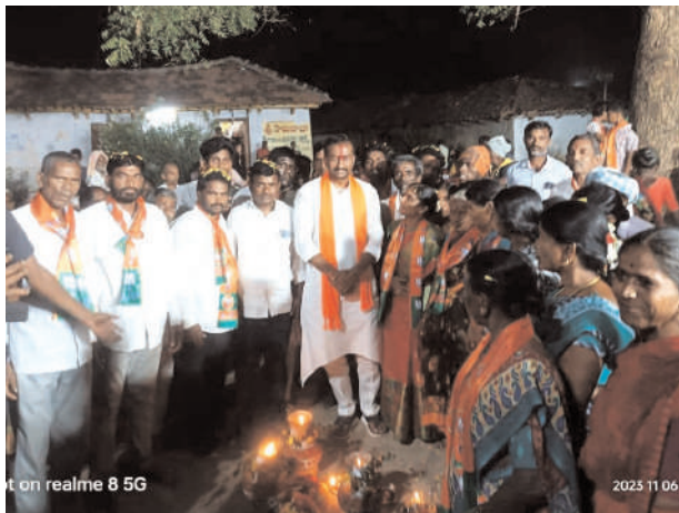
Shot on realme 8 5G 2023 11 06

మిరుదొడ్డి, నవంబర్ 06, మనం న్యూస్: బిఆర్ఎస్ నాయకుల తాటాకు చప్పుళ్లకు భయపడే ప్రసక్తి లేదని దుబ్బాక బీజేపి అభ్యర్థి మాధవనేని రఘునందన్ రావు అన్నారు. సోమవారం మిరుదొడ్డి మండల పరిధిలోని కొండాపూర్, అందె గ్రామాలలో ఇంటింటి ప్రచారం నిర్వహించారు. ప్రచారానికి కొండాపూర్, అందె గ్రామస్థులు మంగళహారతులతో ఘనంగా స్వాగతం పలికారు. ఈ సందర్భంగా ఆయన మాట్లాడుతూ ప్రత్యేక తెలంగాణ రాష్ట్రం ఏర్పడిన తర్వాత రాష్ట్రంలో కుటుంబ పాలన మాత్రమే కొనసాగుతుందన్నారు. జరగజోయే ఎన్నికల్లో బిఆర్ఎస్ పార్టీ అధికారంలోకి వస్తే దొరలు మాత్రమే రాజ్యాన్ని ఏలుతారని ఎద్దేవా చేశారు. బీజేపి అధికారంలోకి వస్తే బిసి బిజ్జెను ముఖ్యమంత్రి చేయడం ఖాయమన్నారు. భూమిలేని దళితులకు మూడెకరాల భూమి, ఇండ్లు లేని నిరుపేద కుటుంబాలకు డబుల్ బెడ్రూమ్ ఇండ్లు, నిరుద్యోగులకు నిరుద్యోగ భృతి, ఇంటికో ఉద్యోగం అని మాయమాటలు చెప్పిన ముఖ్యమంత్రి ఇప్పటికీ పూర్తిగా హామీలు అమలు చేయలేదన్నారు. బిఆర్ఎస్ పార్టీ గద్దెనెక్కి