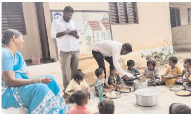
తొగుట, నవంబర్ 06, మనం న్యూస్: పాఠశాలల్లో మధ్యాహ్న భోజన వంట చేసే కార్మికులు తీవ్ర ఇబ్బందులు ఎదుర్కొంటున్నారని డిబిఎఫ్ రాష్ట్ర కార్యదర్శి