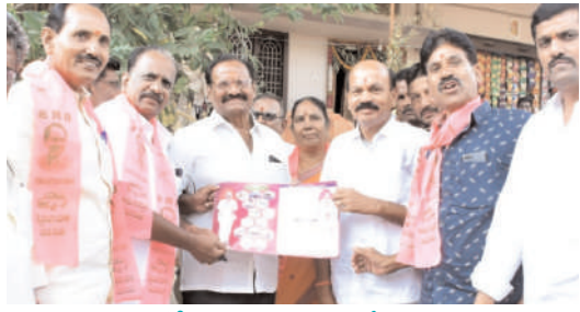
మూడోసారి కేసీఆర్ ప్రభుత్వ ఏర్పాటు ఖాయం