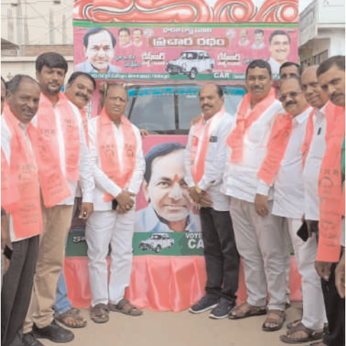
బిఆర్ఎస్ ప్రచార రథం