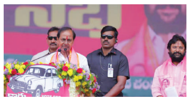
టు వేయాలని, కారు గుర్తుకు ఓటు వేసి కోరుకంటే చందర్ ను ఆశీర్వాదించాలని కోరారు. బిఆర్ఎస్ పార్టీ పుట్టింది తెలంగాణ ప్రజల కోసమన్నారు. యాభై ఏండ్లు పాటించిన కాంగ్రెస్ దేశాన్ని నాశనం చేసి

బెల్లంపల్లి, నవంబర్ 24 (మనం న్యూస్) : ఈ సారి జరుగబోయే ఎన్నికల్లో పోస్టల్ బ్యాలెట్ ను వినియోగించుకునే అవకాశం కల్పించడంతో సాగు జర్నలిస్టులు శుభ్రవారం పోస్టల్ బ్యాలెట్ ద్వారా ఓటు వేసారు. ఎన్నికల రిటర్నింగ్ అధికారి కార్యక్రమాలను పోస్టల్ బ్యాలెట్ ద్వారా ఓటు వేస్తున్న వినియోగించుకున్న అనంతరం తమకు ఈ అవకాశం కల్పించిన ఎన్నికల అధికారులకు దన్యవాదాలు తెలిపారు.