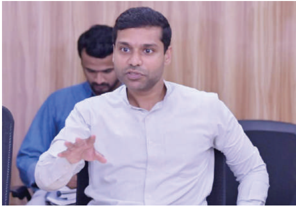
న్నికల అధికారి మాట్లాడుతూ జిల్లాలో ఎన్నికలు సక్రమంగా నిర్వహణకు మూడు నియోజక వర్గాల పరిధిలో స్టాటిక్ సర్వేయింగ్, ప్లయింగ్ స్వాగ్డ్

పెద్దపల్లి, నవంబర్ 08, (మనం ప్రతినిధి): శ్రీ ఆంధ్ పెయర్ ఎన్నికల నిర్వహణకు జిల్లా యంత్రాంగానికి బ్యాంకులు సహకరించాలని కలెక్టర్, జిల్లా ఎన్నికల అధికారి ముజమ్మిల్ ఖాన్ తెలిపారు. బుధవారం స మిక్చర్ జిల్లా కలెక్టరేట్లోని సమావేశ మందిరంలో కలెక్టర్, బ్యాంక్ అధి కారులతో సమావేశం నిర్వహించారు. ఈ సమావేశంలో కలెక్టర్, జిల్లా ఎ