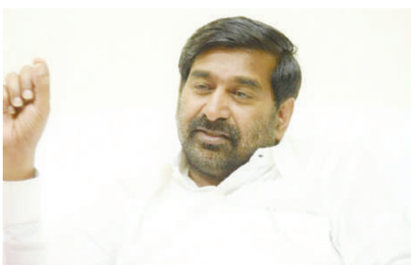
ప్రజలు ఇబ్బంది పడే పనులను సహించే ప్రసక్తేలేదు

అధికార బిఆర్ఎస్ పార్టీని అడ్డం పెట్టుకుని ప్రజలను ఇబ్బందిపెట్టే పనులను మా పార్టీ నాయకులైన సరే గడిచిన 9 సంవత్సరాలలో ఏనాడు సహించలేదని, ఇప్పుడు పార్టీని వీడి తనపై విమర్శలు గుప్పించిన వారు అత్యధిమర్చు చేసుకోవాలన్నారు. తమ ఆటలు తన పాలనలో సాగవని తెలిసి పార్టీతో తెగింపు చేసుకుని, బిఆర్ఎస్ పార్టీకి మచ్చ తెచ్చే విధంగా ఆరోపణలు చేస్తున్నారని, జీవిత ప్రతిష్టలకు తరచు విమర్శిస్తున్న విధంగా తానెప్పుడు ఏ సామాజిక వర్గాన్ని కించపరిచే విధంగా వ్యవహరించలేదని ఒక ప్రశ్నకు బదులిచ్చారు.