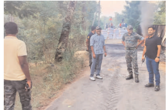
నజర్ పెట్టామని తెలిపారు.