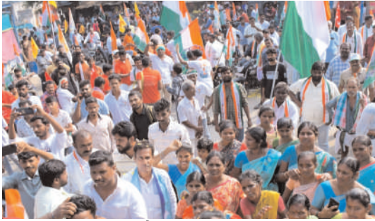
జై కాంగ్రెస్, జై జై పాయం ;