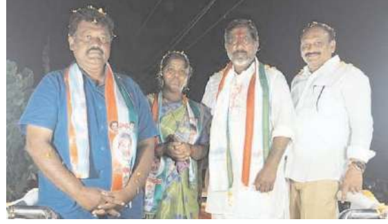
పార్టీలో చేరినట్లు హామీ సందర్భంగా తెలియజేశారు.