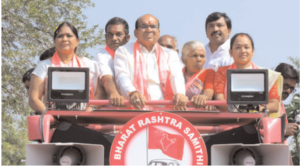
నియోజకవర్గంలో అభివృద్ధి, సంక్షేమ