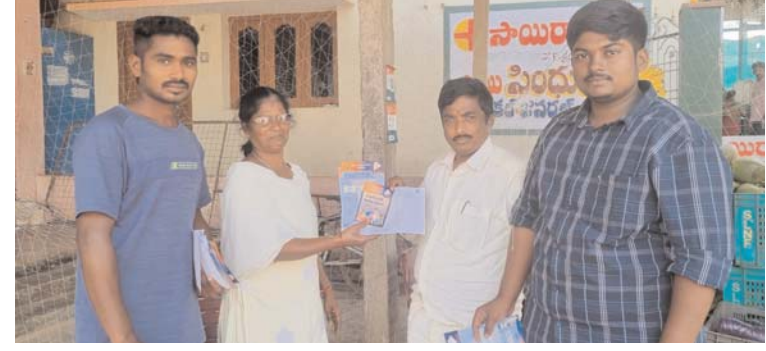
స్వేచ్ఛగా, ఎలాంటి ప్రలోభాలకు లొంగకుండా ఓటు వేసేలా అవగాహన కల్పించాలన్నారు. సి విజిల్ యాప్ గురించి అవగాహన కల్పించి, యాప్ డౌన్లోడ్ చేసుకునేలా చైతన్యం తేవాలన్నారు. సి విజిల్ యాప్ బ్యారన్లు గ్రామాల్లో ప్రదర్శించాలన్నారు. ఈ సందర్భంగా గ్రామంలోని వృద్ధులకు ఓటు హక్కు పై అవగాహన కల్పించారు. డబ్బు, మద్యం, ఎలాంటి ప్రలోభాలకు లొంగవద్దని, ఓటుహక్కును న్యాయబద్ధంగా వినియోగించుకోవాలని సూచించారు.