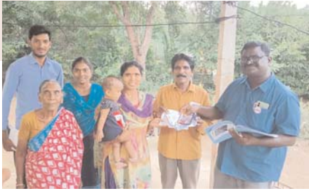
ఓటు హక్కును సద్వినియోగం చేసుకోవాలని తెలిపారు.

ఓటు వేయాలని, ఎలాంటి ప్రలోభాలకు గురికాకుండా నైతికంగా ,నిర్భయంగా ఓటు వేయాలని సూచించారు, సరైన అభ్యర్థికి ఓటు వేయాలని, డబ్బులు తీసుకోవడం ప్రలోభాలకు లొంగి ఓటు వేయకూడదు అన్నారు, ఓటు హక్కు ఉన్న ప్రతి పౌరుడు, ప్రతి పౌరురాలు