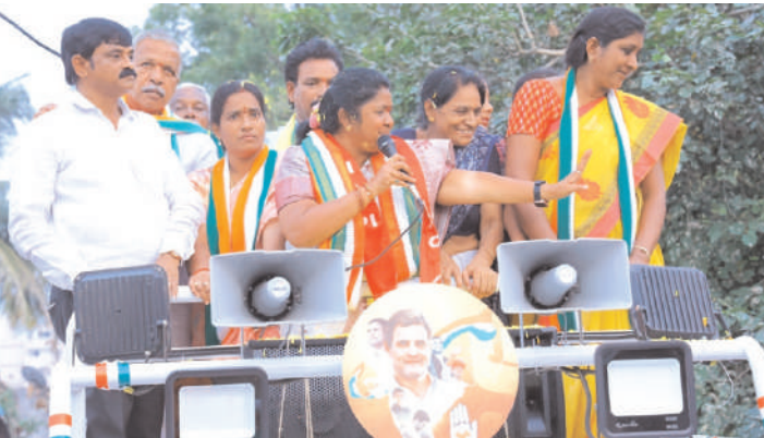
పురు కాంగ్రెస్, సిపిఐ, టిడిపి నాయకులు పాల్గొన్నారు.