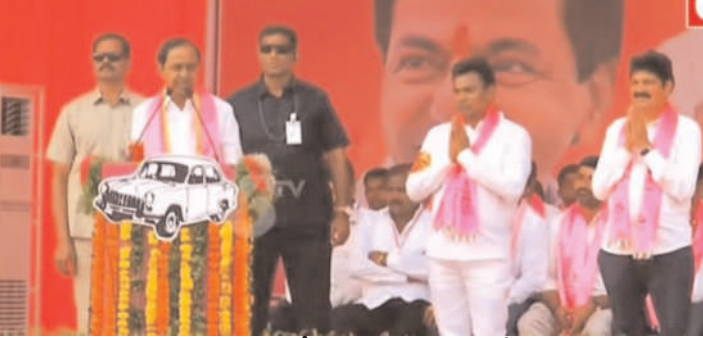
గిరిజనులందరికీ పోడు పట్టాలివ్వాలి : రేగా కాంతారావు

బూర్గంపహాడ్, నవంబర్ 13 (మనం న్యూస్): భద్రాచలం, పినపాక నియోజకవర్గాలను అభివృద్ధి చేస్తానని సిఎం కేసీఆర్ పేర్కొన్నారు. భద్రాచలంలో వరదల నివారణకు వెయ్యి కోట్లతో కరకట్ట నిర్మాణం చేపడతామని పేర్కొన్నారు. బూర్గంపహాడ్ మండల పరిధిలోని లక్ష్మీపురం గ్రామంలో సోమవారం సాయంత్రం జరిగిన ప్రజా ఆశీర్వాద సభలో సిఎం కేసీఆర్ ప్రసంగించారు. భద్రాచలం, పినపాక బిఆర్ఎస్ అభ్యర్థులను గెలిపిస్తే దళిత బంధు ప్రాజెక్టును పైలెట్ ప్రాజెక్టుగా తీసుకొని ఒకేసారి అమలు చేస్తామని కేసీఆర్ హామీ ఇచ్చారు. గత వరదల్లో 14 వేల కుటుంబాలకు పదివేల సాయం చేసామన్నారు. రాష్ట్రంలోని ప్రతి నియోజకవర్గంలో వంద పడకల వైద్యశాల నిర్మాణం చేశామని, ఇప్పటికే రాష్ట్రంలో 103 డయాలసిస్ సెంటర్లు ప్రారంభించామని తెలిపారు. భద్రాచలం నియోజకవర్గం లో పలు వాగులపై బ్రిడ్జిల నిర్మాణం చేపడతామన్నారు. బిటిపిఎస్ ధర్మల్ ఫ్లాంట్ తో యువతకు ఉపాధి కల్పించినట్లు తెలిపారు. పోడు భూములకు పట్టాలి ఇచ్చిన ఘనత బిఆర్ఎస్ ప్రభుత్వానిదేనన్నారు. పోడు రైతులకు తక్షణమే రైతుబంధు, రైతు బీమా సదుపాయం కల్పించామని, వారిపై ఉన్న కేసులను ఎత్తివేశామని తెలిపారు. రైతులకు ఇబ్బంది లేకుండా 300 కోట్ల రూపాయల వ్యయంతో రాష్ట్రమంతా ట్రిపిల్ కరెంటు ఇప్పించిన ఘనత బిఆర్ఎస్ ప్రభుత్వానిదేనన్నారు. ధరణి పోర్ట్ లో బయోమెట్రిక్ ఉంటేనే భూమి బదలాయింపు సాధ్యమన్నారు. అనుకున్నట్లుగా కరకట్ట నిర్మాణానికి వెయ్యికోట్లతో శ్రీకారం చుడతానని అవసరమైతే రెండు రోజులు అధికారులతో అందరితో వచ్చి ఇక్కడే ఉంటానని, ఆ ప్రాజెక్టు ప్రారంభం చేస్తానని హామీ ఇచ్చారు.