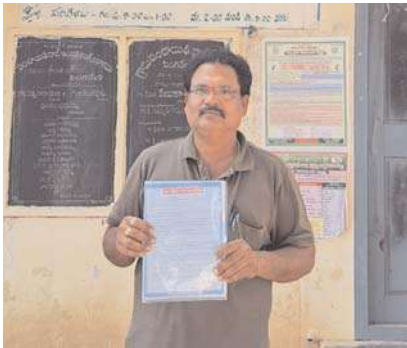
జరుగుతుందన్నారు. తెలంగాణ రాష్ట్రంలో నూతనంగా ఏర్పడబోయే ప్రభుత్వం ఇప్పటికైనా సింగరేణి గ్రామ ఘన చరిత్రను గుర్తించి గ్రామాన్ని అభివృద్ధి చేయడమే గాక బొగ్గు గనుల పుట్టినిల్లు అయిన సింగరేణి గ్రామాన్ని పర్యాటక కేంద్రంగా తీర్చిదిద్దాలని కోరుతూ 10 అంశాలతో ఈ మ్యానిఫెస్టో ను అన్ని రాజకీయ పార్టీల దృష్టికి తీసుకెళ్లడం జరుగుతుందని పేర్కొన్నారు.

గ్రామం మాత్రం నేటికీ పూర్తిస్థాయిలో అభివృద్ధికి నోచుకోలేదన్నారు. దత్తత తీసుకుంటున్నామని అనేకసార్లు ప్రకటించినా ఆచరణకు మాత్రం నోచుకోలేదని ఆవేదన వ్యక్తం చేశారు. సమైక్య రాష్ట్ర పాలనలో ఎంతో నిరాదరణకు గురైన సింగరేణి గ్రామం స్వరాష్ట్రమైన తెలంగాణ లోనైన అభివృద్ధి చెందుతుందని గ్రామస్థులు ఆశించినా, అభివృద్ధి మాటిమాటిగాని కనీసం తగిన గుర్తింపుకైనా సింగరేణి గ్రామం నోచుకోలేదన్నారు. ప్రతి సంవత్సరం సింగరేణి అవిర్భావ దినోత్సవం అధికారికంగా సింగరేణి గ్రామంలో జరుపుతామని సంస్థ ప్రతినిధులు అనేకసార్లు హామీలు ఇచ్చిన అవి నీటిమాటలుగానే మిగిలిపోయాయి అన్నారు. బొగ్గు గనుల పుట్టినిల్లుగా సింగరేణి గ్రామాన్ని పూర్తిస్థాయిలో అభివృద్ధి చేయాలని,ఈ గ్రామాన్ని పర్యాటక కేంద్రంగా తీర్చిదిద్దాలని కోరుతూ ఈనెల 30వ తేదీన జరిగే తెలంగాణ శాసనసభ ఎన్నికల్లో వైరా శాసనసభ నియోజకవర్గం నుండి పోటీ చేస్తున్న ఆయా పార్టీల అభ్యర్థులకు మా ఊరు-మా మ్యానిఫెస్టో పేరుతో ఈ వినతి పత్రం ఇవ్వడం