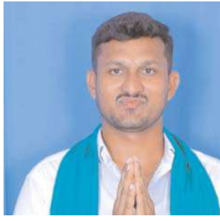
కేసు పెట్టడంపై పేర్కొన్నారు.

చర్చించి అందరం కలిసికట్టుగా నిర్ణయాలు తీసుకునే పద్ధతుల్లో తీసుకువస్తానని తెలిపారు. ప్రతి ఇంటికి అర్హతను బట్టి ఒక ఉద్యోగాన్ని కచ్చితంగా ఇస్తానని జరిగిన అవినీతిని బయటకు తీసి అవినీతి జరుగకుండా చూస్తానని పేర్కొన్నారు. డిజిటల్ లైబ్రరీ కోచింగ్ కాలేజీ స్టడీ హాల్స్ స్పోర్ట్స్ స్టేడియాన్ని విద్యార్థుల కోసం ఏర్పాటు చేస్తానని, నేను చెప్పింది చేయని పక్షంలో నాపై సివిల్