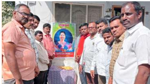
శ్రీకృమార్ ను పరామర్శించిన