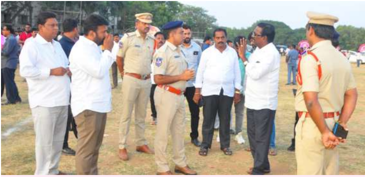
ఖమ్మంలో కేసీఆర్ సభా స్థలిని పోలీస్ అధికారులతో పరిశీలించిన మంత్రి పువ్వాడ (వార్త 12లో..)