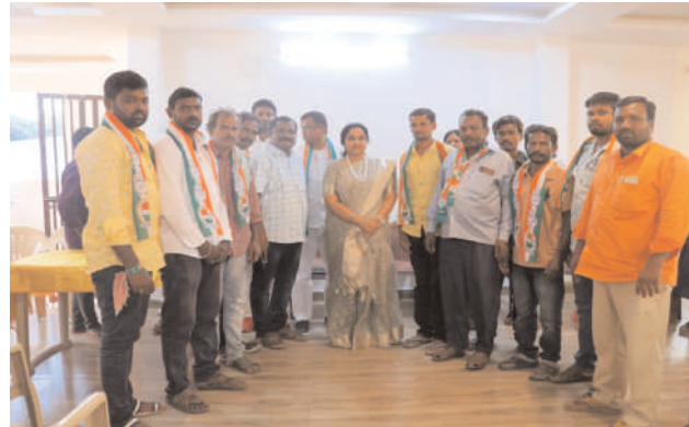
పథకాలకు ఆకర్షణలై స్టేషన్ ఘనపూర్ కాంగ్రెస్ పార్టీ ఎమ్మెల్యే అభ్యర్థి టిపిసిసి