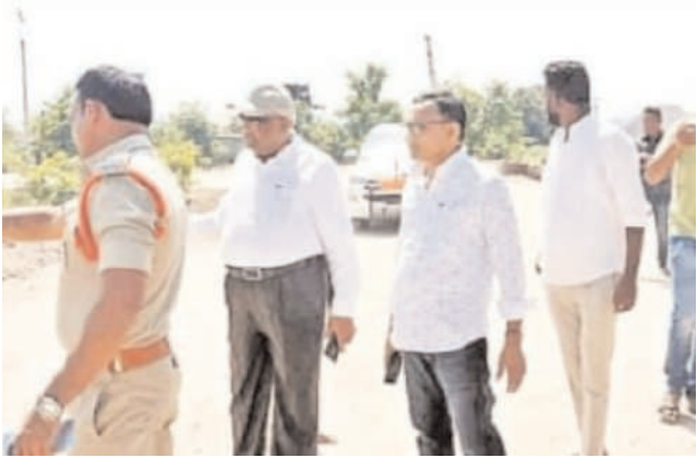
- దెబ్బతిన్న పిల్లల్ని పరిశీలన..