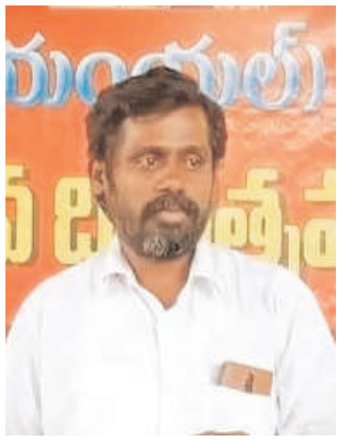
ఎన్నికల్లో పాలకుర్తి, వర్ధన్నపేట నియోజకవర్గాలలో తొలిసారిగా పార్టీ