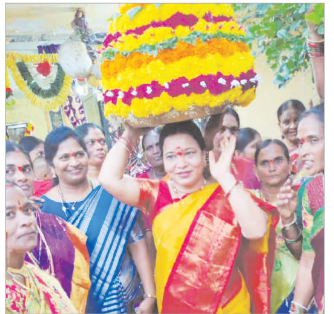
ఎన్ నాయకులు, కార్యకర్తలు, మహిళలు తదితరులు పాల్గొన్నారు.

అంతా ఒకటే అంటూ జరుపుకునే సాంస్కృతిక పండుగ బతుకమ్మ పండుగ అన్నారు. బతుకమ్మ బతుకమ్మ ఉయ్యాలలో అని సాగే ఈ పాటల్లో మహిళలు తమ కష్ట సుఖాలు, ప్రేమ, స్నేహం, బంధుత్వం, ఆప్యాయతలు, భక్తి, భయం, చరిత్ర, పురాణాలు మేళవిస్తారని అన్నారు. ఈ పాటలు చాలా వినసాంపుగా ఉంటాయన్నారు. తెలంగాణ అస్తిత్వం బతుకమ్మలోనే ఉందన్నారు. అందుకే బతుకమ్మ అంటే ప్రకృతి పండుగ, బతుకమ్మ అంటే పూల పండుగ, బతుకమ్మ అంటే మనిషి ప్రకృతితో మమేకం అయ్యే అత్యంత అరుదైన అద్భుతమైన పండుగ బతుకమ్మ పండుగ అన్నారు. ఈ కార్యక్రమంలో ప్రజాప్రతినిధులు, బి ఆర్