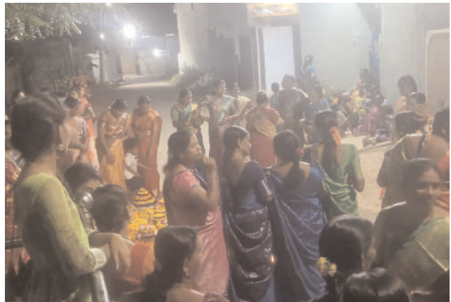
ఆశ్వయుజ మాసంలో అమావాస్య నుంచి ప్రారంభమయ్యే మొదటి రోజు

రఘునాథపల్లి, అక్టోబర్ 14, మనం న్యూస్ : తొమ్మిది రోజుల పాటు ఆంగరంగ వైభవంగా జరుపుకునే బతుకమ్మ వేడుకలు మండల కేంద్రంతో పాటు మండలంలోని అన్ని గ్రామాలలో శనివారం ఉత్సాహంగా ప్రారంభమయ్యాయి. మండల కేంద్రంలోని శ్రీవ మహాదేవ స్వామి ఆలయం ముందు, బొడ్డాయి, ఆర్య క్షత్రియ భవనం, వెల్లి క్రాస్ రోడ్డు సమీపంలోని రేణుక ఎల్లమ్మ దేవాలయం వద్ద మహిళలు బతుకమ్మ బతుకమ్మ ఊయ్యాలో అంటూ ఉత్సాహ పూరిత వాతావరణంలో బతుకమ్మ పండుగ ప్రారంభ వేడుకలను వైభవంగా జరుపుకున్నారు. ప్రతి సంవత్సరం