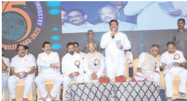
శాసనమండలి డిప్యూటీ చైర్మన్ బండా మధుసూదన చారి, ఇతర ప్రజాప్రతినిధులతో కలిసి హాజరైనారు.