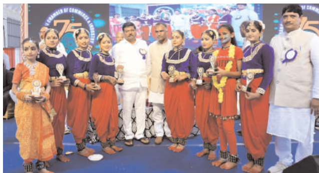
వరంగల్, అక్టోబర్ 1, మనం న్యూస్ : ఛాంబర్ ఆఫ్ కామర్స్ అండ్ ఇండస్ట్రీ 75 వసంతాలు పూర్తి చేసుకున్న సందర్భంగా ఛాంబర్ ఆఫ్ కామర్స్ వారు నిర్వహించిన వజ్రోత్సవ వేడుకలకు ఎమ్మెల్యే నన్నపునేని సరేందర్