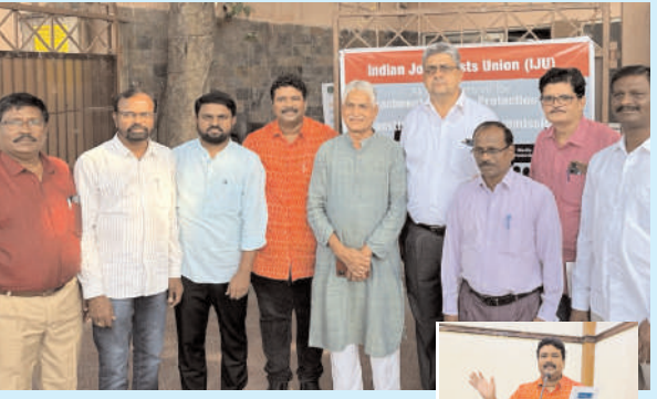
వరంగల్, అక్టోబర్ 1, మనం న్యూస్ : ఢిల్లీలో జరుగుతున్న జాతీయ మీడియా సదస్సుకు హాజరైన టీయూడబ్ల్యూజే ప్రతినిధి బృందం.