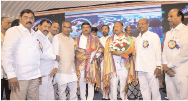
వరంగల్, అక్టోబర్ 1, మనం న్యూస్ : వరంగల్ ఛాంబర్ ఆఫ్ కామర్స్ అండ్ ఇండస్ట్రీ 75 వసంతాలు పూర్తి చేసుకున్న సందర్భంగా ఛాంబర్ ఆఫ్ కామర్స్ వారు నిర్వహించిన వజ్రోత్సవ వేడుకలకు ఎమ్మెల్యే నన్నపునేని సరేందర్