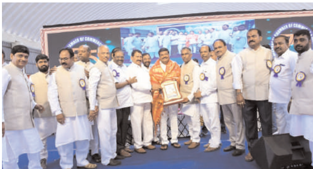
వరంగల్, అక్టోబర్ 1, మనం న్యూస్ : ఛాంబర్ ఆఫ్ కామర్స్ అండ్ ఇండస్ట్రీ 75 వసంతాలు పూర్తి చేసుకున్న సందర్భంగా ఛాంబర్ ఆఫ్ కామర్స్ వారు నిర్వహించిన వజ్రోత్సవ వేడుకలకు ఎమ్మెల్యే నన్నపునేని సరేందర్