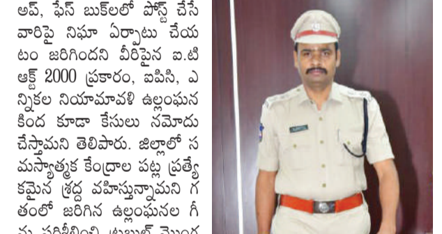
అమ్, ఫేస్ బుక్ లో పోస్ట్ చేసే వారిపై నిఘా ఏర్పాటు చేయటం జరిగిందని వివేకం బి.టి.ఆర్ 2000 ప్రకారం, బిజెపి, ఎన్నికల నియమావళి ఉల్లంఘన కింద కూడా కేసులు నమోదు చేస్తామని తెలిపారు. జిల్లాలో సమస్యత్వ కేంద్రాల పట్ల ప్రత్యేక కమిటీ శ్రద్ధ వహిస్తామని గతంలో జరిగిన ఉల్లంఘనల గురించి పరిశీలించి మొగ్గల మొగ్గల రిలం బ్లెడ్ వర్షు చేశామని, ఈ కేంద్రాల వద్ద పట్టుమొన బండ్ బస్సు కూడా సేస్తామని ఆయన తెలిపారు. కాంతిభద్రతలకు విఘ్నం కలిగించే చర్యలకు ఎవరైనా పాల్పడిన ఎన్నికల నియమావళి ప్రకారం ప్రజా ప్రతినిధ్య పట్టం 1951 ప్రకారం కఠిన చర్యలు తీసుకుంటామని హెచ్చరించారు.

కరీంనగర్ జైం, అక్టోబర్ 15, (మనం న్యూస్): ఎన్నికల నియమావళి ఉల్లంఘిస్తే కఠిన చర్యలు తీసుకోవచ్చు పోలీసు కమిషనర్ ఎల్.సుబ్బారాయుడు ఒక ప్రకటనలో హెచ్చరించారు. నియమ నిబంధనలను ఉల్లంఘించిన వారు తరువాత జరుగుతున్న ఎన్నికల్లో కూడా ఎలెక్టోరల్ నేరస్థులుగా పరిగణించబడి వీరిపై నిఘా, బ్లెడ్ వర్షు చేయటం జరుగుతుందని తెలిపారు. ఏదేని రాజకీయ పార్టీ ఎన్నికల నియమావళి అనుసారం అనుమతి పొంది ముందస్తుగా సమాచారం అందించిన యెడల వారికి నిరేఖిత స్పెషల్ అనుగుణంగా ముందస్తు బండ్ బస్సులు ఏర్పాటు చేస్తామని తెలిపారు. ఎవరు అయిన అనుమతి లేని మీటింగ్ లు, రాష్ట్ర లీలు హార్సల్ నిర్వహించినట్లయితే వారిపై కూడా కఠిన చర్యలు ఉంటాయని హెచ్చరించారు. ఎన్నికల నియమావళి అమలులో ఉన్న సమయంలో వర్ష వైమోచాలను లేదా అసలీత, రెవ్యూ గ్రామీణ వ్యాఖ్యలు సత్కారాల అయిన వ్యాఖ్యలు సోషల్ మీడియా లోగాని ప్రచురించి, ఎలక్షానిక్ మీడియాలో ఇచ్చినా, పోస్ట్ చేసిన వారిపై కఠిన చర్యలు ఉంటాయని ఆయన హెచ్చరించారు. సోషల్ మీడియా ప్లాట్ ఫారమ్స్ అయిన ట్విట్టర్, వాట్సాప్