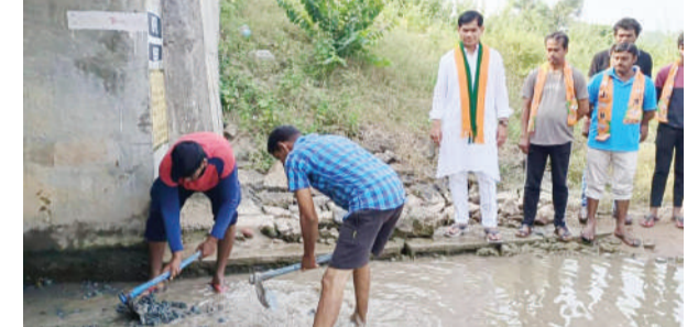
వాహనాల రాకపోకలకు బ్రెడ్డి కింద కంకర మరియు మోరం పోయిందని అందించారు. ఇప్పటికైనా ఈ సమస్యకు శాశ్వత పరిష్కారం కావాలంటే ఫ్లై ఓవర్ కట్టాలిని అన్నారు. తమకు అవకాశం ఇచ్చి గెలిపిస్తే ఫ్లై ఓవర్ నిర్మాణం చేయిస్తామని హామీ ఇచ్చారు.