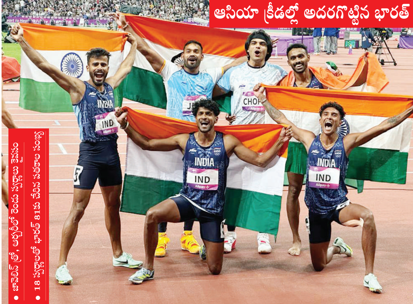
ఆసియా క్రీడల్లో అదరగట్టిన భారత్

• జావెలిన్ త్రో, అర్జెంట్లో రెండు స్వర్ణాలు కైవసం • 18 స్వర్ణాలతో భారత్ 81వ చేరిన పతకాల సంఖ్య