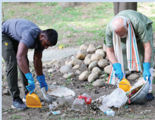
చీపురు పట్టి.. చెత్తను ఎత్తి.. ప్రధాని మోడీ శ్రమదానం! 2

AMARAVATHI | TIRUPATI | KURNOOL | ELURU | VISHAKAPATNAM | ANANTHAPURAM | KADAPA | HYDERABAD | KARIMNAGAR | NIZAMABAD | NALGONDA | MAHABUBNAGAR | WARANGAL | KHAMMAM భాద్రపద మాసం, సోమవారం, తిథి : తదియ ఉ.07.36 వరకు, వక్షతం: భరణి, సా:06.24 వరకు, వర్జ్యం: ఉ.06.14-07.48 వరకు, దుర్ముహూర్తం: మ.12.29-01.16 వరకు, రాహుకాలం: సా.07.38-09.07 వరకు