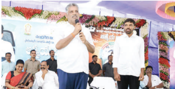
ఆ ఇద్దరినీ గెలిపించండి