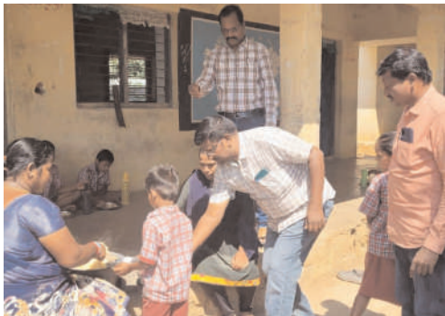
పాఠశాలలో ఆల్పహారంను అందిస్తున్న ఉపాధ్యాయులు