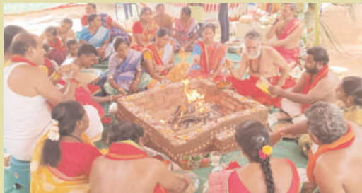
హోమం నిర్వహిస్తున్న భక్తులు