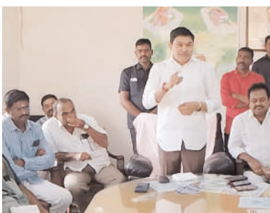
మాట్లాడుతున్న ఎమ్మెల్యే సైదిరెడ్డి