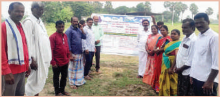
కేంద్రాన్ని ప్రారంభిస్తున్న దృశ్యం