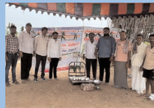
ధాన్యం కొనుగోలు కేంద్రాలను ప్రారంభిస్తున్న అధికారులు