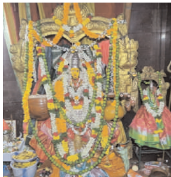
- 25వ వార్షికోత్సవం అన్నదాన