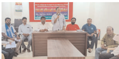
సమావేశంలో మాట్లాడుతున్న నాయకులు

సూర్యాపేట టౌన్ అక్టోబర్ 20 మనం న్యూస్: జనాభా దమాషా ప్రకారం దళితులకు కేంద్ర, రాష్ట్ర ప్రభుత్వాలు బడ్జెట్ లో నిధులను కేటాయించాలని, వారి అభ్యున్నతికి ఖర్చు చేయాలని, దళితులపై జరుగుతున్న దాడులను, హత్యలు, అత్యచారాలను నియంత్రించేందుకు ప్రత్యేక చట్టాలు తేవాలని తెలంగాణ వ్యవసాయ కార్యక సంఘం రాష్ట్ర అధ్యక్షుడు జి.నాగయ్య డిమాండ్ చేశారు. శుక్రవారం జిల్లా కేంద్రంలోని యూటిఎఫ్ కార్యాలయంలో