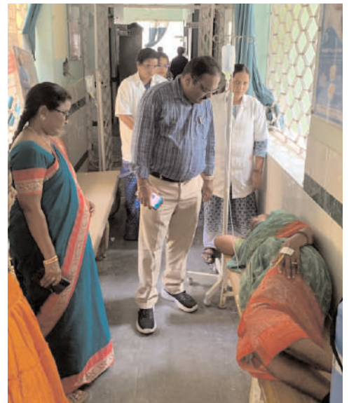
ఆసుపత్రులను పరిశీలిస్తున్న డిఎంహెచ్ఓ

సూర్యాపేట టౌన్ అక్టోబర్ 20 మనం న్యూస్: సూర్యాపేట మండల పరిధిలోని కాసరబాద, ఇమాంపేట పల్లె దవాఖనాలను శుక్రవారం డిఎంహెచ్ఓ కోటాచలం ఆకస్మికంగా పరిశీలించారు. ఈ సందర్భంగా ఆయన మాట్లాడుతూ..... ఆరోగ్య కేంద్రాలలో ప్రజలకు వైద్యులు అందుబాటులో ఉంటు వైద్య సేవలను అందించాలని సూచించారు. ఆసుపత్రులలో సాధారణ కాస్టులు ఎక్కువగా జరపాలని, రక్త పరీక్షలు టీ హాబ్ కు పంపాలని ఆదేశించారు. అనంతరం పల్లె దవాఖనాలలో చికిత్స తీసుకుంటున్న మహిళలను వైద్య సేవలపై ఆరా తీశారు. పక్కనే ఉన్న ప్రకృతివనం, హరితహారం నర్సరీలను సందర్శించారు.