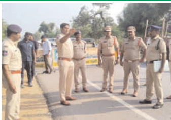
సూచనలు చేస్తున్న ఎస్పీ