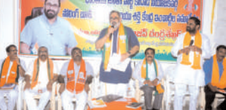
శాఖ కేంద్ర సహాయ మంత్రి రాజీవ్ చంద్రశేఖర్.