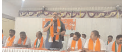
సమావేశంలో మాట్లాడుతున్న కేంద్ర సహాయ మంత్రి

తుంగతుర్తి అక్టోబర్ 15 మనం న్యూస్: తెలంగాణ రాష్ట్రంలో 9 ఏండ్ల బీఆర్ఎస్ పాలనలో అభివృద్ధి