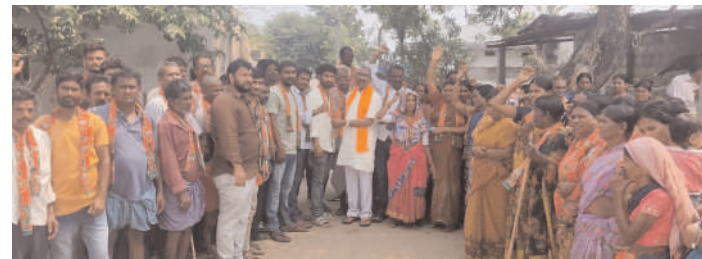
పార్టీ కండువ కప్పి ఆహ్వానిస్తున్న దశ్యం