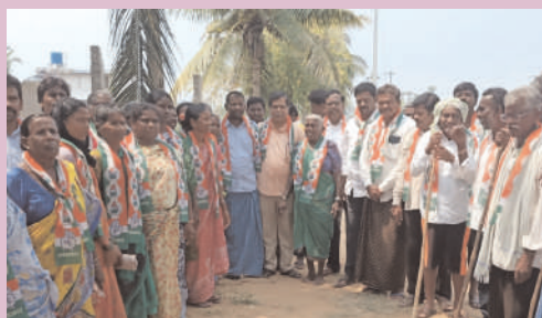
పార్టీ జెండా కప్పుతున్న నాయకులు