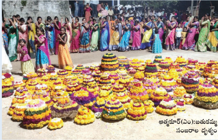
ఆత్మకూర్(ఎం):బతుకమ్మ సంబరాల దృశ్యం