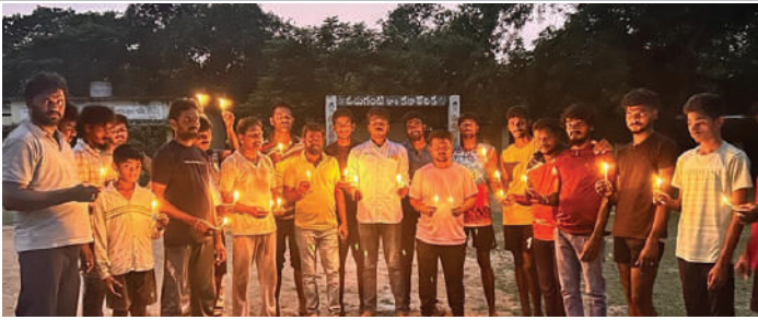
కొవ్వత్తులతో నిరసన తెలుపుతున్న యువకులు