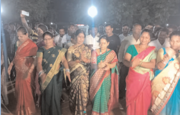
వలిగొండ: బతుకమ్మ సంబరాల్లో పాల్గొన్న ఎమ్మెల్యే సతీమణి