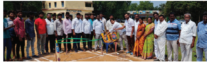
క్రీడలను ప్రారంభిస్తున్న నాయకులు