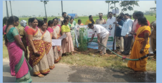
మొక్కలు నాటుతున్న దృశ్యం