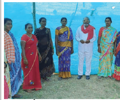
బాధితులతో సీపిఎం నాయకులు

తిరుమలగిరి ఆక్టోబర్ 14 మనం న్యూస్: మండల పరిధిలోని బండపల్లి గ్రామ పంచాయితీలో 38వ సర్వే నెంబర్లో గల ప్రభుత్వ భూమిలో పేదలు శనివారం ఇంటి స్థలాల కోసమని గుడిసెలు వేశారు.