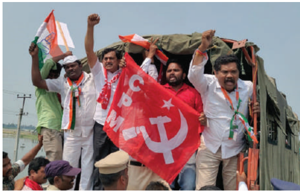
సడక్ బండ్ ను నిర్వహిస్తున్న నాయకులను అరెస్టు చేస్తున్న దృశ్యం

సూర్యాపేట టౌన్ ఆక్టోబర్ 14 మనం న్యూస్: టిఎన్ పిఎస్ ని ప్రస్తుత బోర్డు చైర్మన్ తో సహా అందులోని అమ్ముకుని లీకేజీ పాల్పడ్డారని ఆరోపించారు.