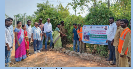
మొక్కలకు నీళ్లు పోస్తున్న దృశ్యం