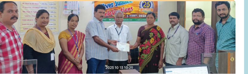
మృతుడి కుటుంబ సభ్యులకు చెక్ అందజేస్తున్న దృశ్యం