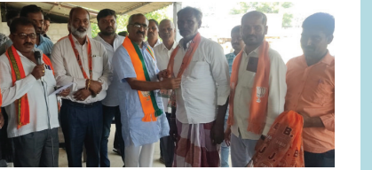
పార్టీ కండువ కప్పి ఆహ్వానిస్తున్న దృశ్యం