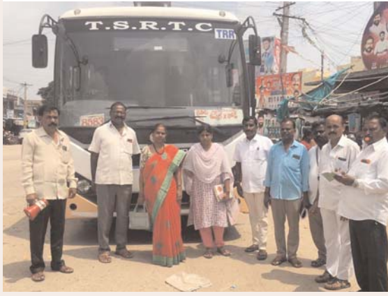
తిరుమలగిరి నుండి హైదరాబాద్ కు బస్ సర్వీస్