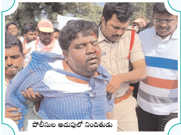
పోలీసుల అదుపులో నిందితుడు

మంగళవారం | 31 | అక్టోబర్ | 2023 | పేజీలు : 7