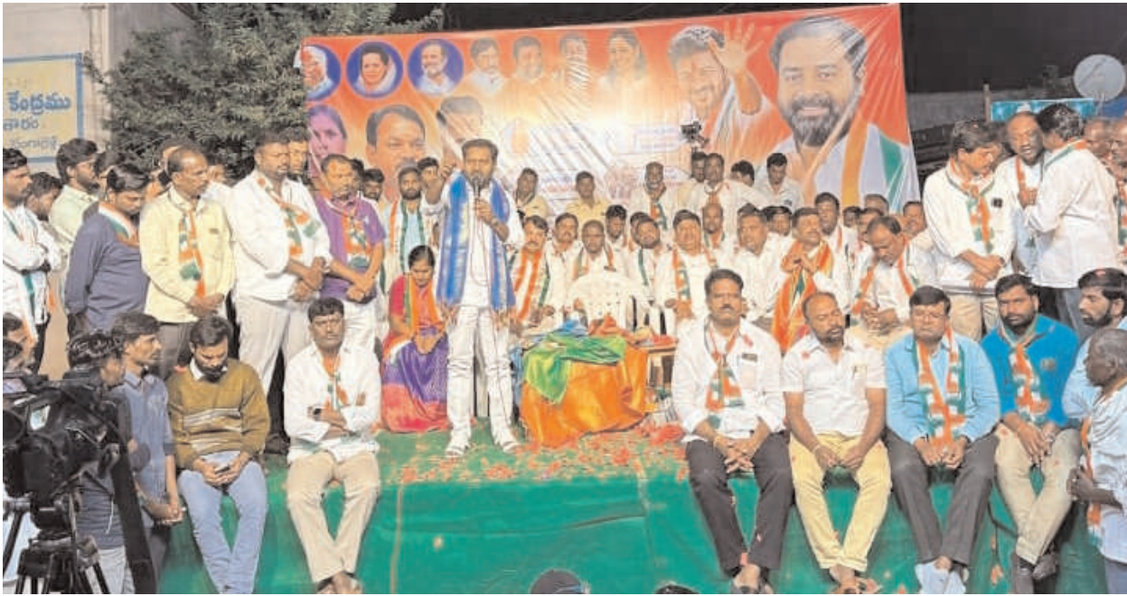
-కాంగ్రెస్ లోకి భారీగా చేరికలు