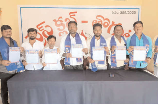
తొగుట, అక్టోబర్ 27, మనం న్యూస్: తొగుట మండల కేంద్రంలో హలో మాదిగ చలో ఇందిరా పార్కు మాదిగల యుద్ధభేరి నవంబర్ 5న జరిగే సభ కరపత్రం ఆవిష్కరణ శుక్రవారం తొగుటలో నిర్వహించారు. ఈ సందర్భంగా వారు మాట్లాడుతూ సామాజిక, ఆర్థిక, రాజకీయ, న్యాయపరమైన వాటాకై