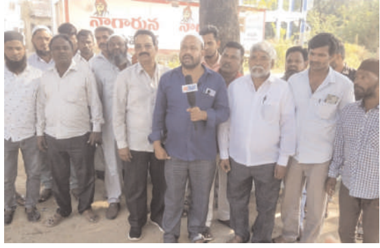
బిఆర్ఎస్ పార్టీకి మండల