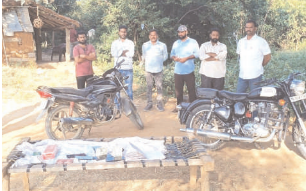
సూచించారు. పేకాట, జూదం వంటి చట్ట వ్యతిరేక కార్యక్రమాలు నిర్వహించే వారిపై కఠిన చర్యలు తీసుకుంటామని హెచ్చరించారు.