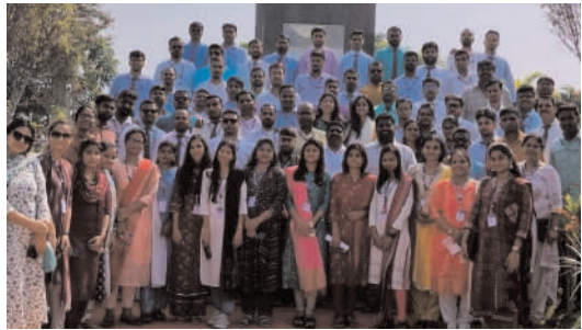
మిషన్ భగీరథను సందర్శించిన