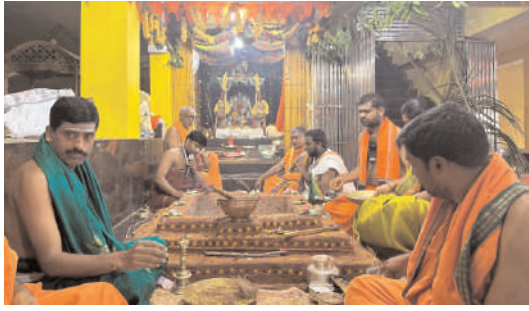
దేవి నవరాత్రి ఉత్సవాలకు అంకురార్పణం మహాగణపతి పూజ మహా గణపతి హోమం