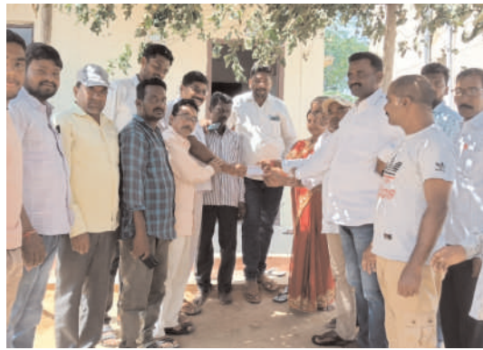
నిరుపేద వధువు వివాహానికి